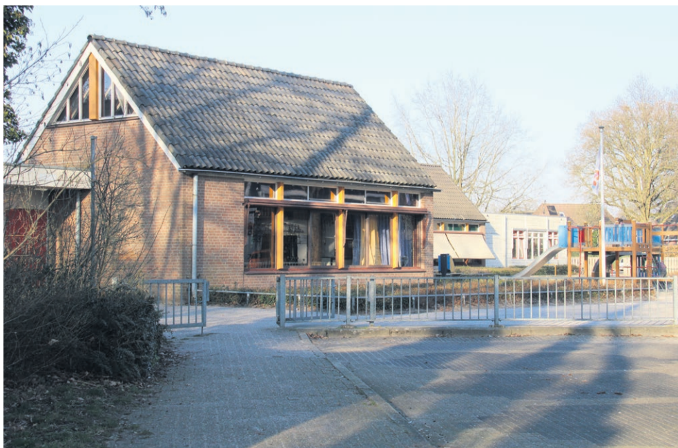
Wijkbewoners worden actief betrokken bij de herinrichting van het vrijkomende perceel.

den vóór 1 april via het aanmeldformulier op de website van ANV Hooltwark: hooltwark.nl . Na aanmelding wordt de locatie beoordeeld. Mocht de grond niet geschikt zijn, wordt meegekeken naar een alternatief. Deelname aan de regeling geeft, in het kader van het Gemeenschappelijk Landbouwbeleid (GLB), mogelijkheden voor extra vergoedingen. Het advies is om dit af te stemmen met een adviseur, zodat er kan worden meegedacht over het indienen van een goed teeltplan.