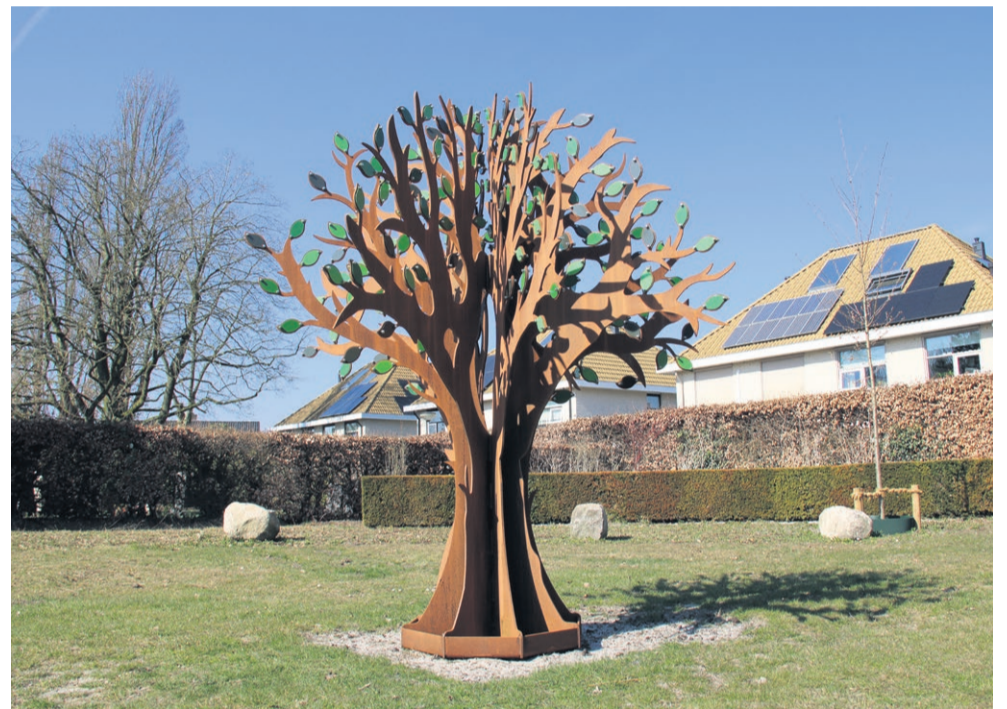
Op de blaadjes aan de takken van de Troostboom kunnen namen van overledenen worden gegraveerd.

Vorig jaar werden al twee andere herdenkingsplekken toegevoegd. Op het urnenveld kunnen nabestaanden een urnenkelder reserveren voor urnen of asbussen. Daarnaast is het mogelijk om een levende herdenkingsboom te planten. Deze bomen, beschikbaar in verschillende groottes, staan in twee cirkels en bieden een blijvende herinnering aan dierbaren.