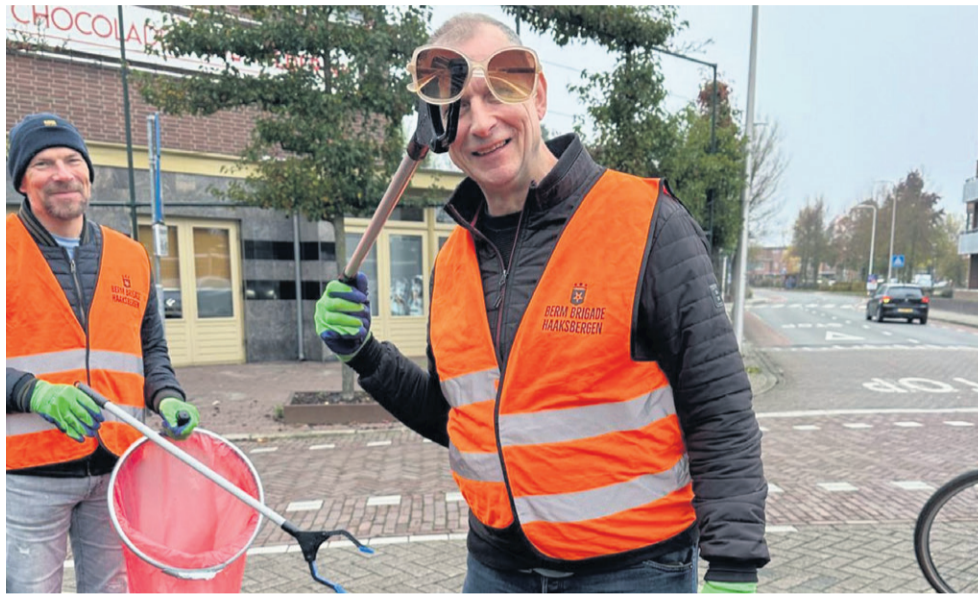
Zo'n 175 vrijwilligers gaan regelmatig op pad om zwerfafval op te ruimen. Meer vrijwilligers zijn welkom.

Maandagavond 16 december organiseerde de gemeente Haaksbergen een speciale bijeenkomst voor de BermBrigade in het Huis van Haaksbergen (De Kappen). De avond stond in het teken van zwerfafval, de successen van de vrijwilligers en ideeën voor een schonere toekomst. Zo'n 175 vrijwilligers zetten zich regelmatig in om de straten van Haaksbergen schoon te houden. En met resultaat: de afgelopen jaren is de gemeente zichtbaar schoner geworden. Tegelijkertijd blijft zwerfafval een uitdaging, waardoor de inzet van de BermBrigade nog steeds hard nodig is.