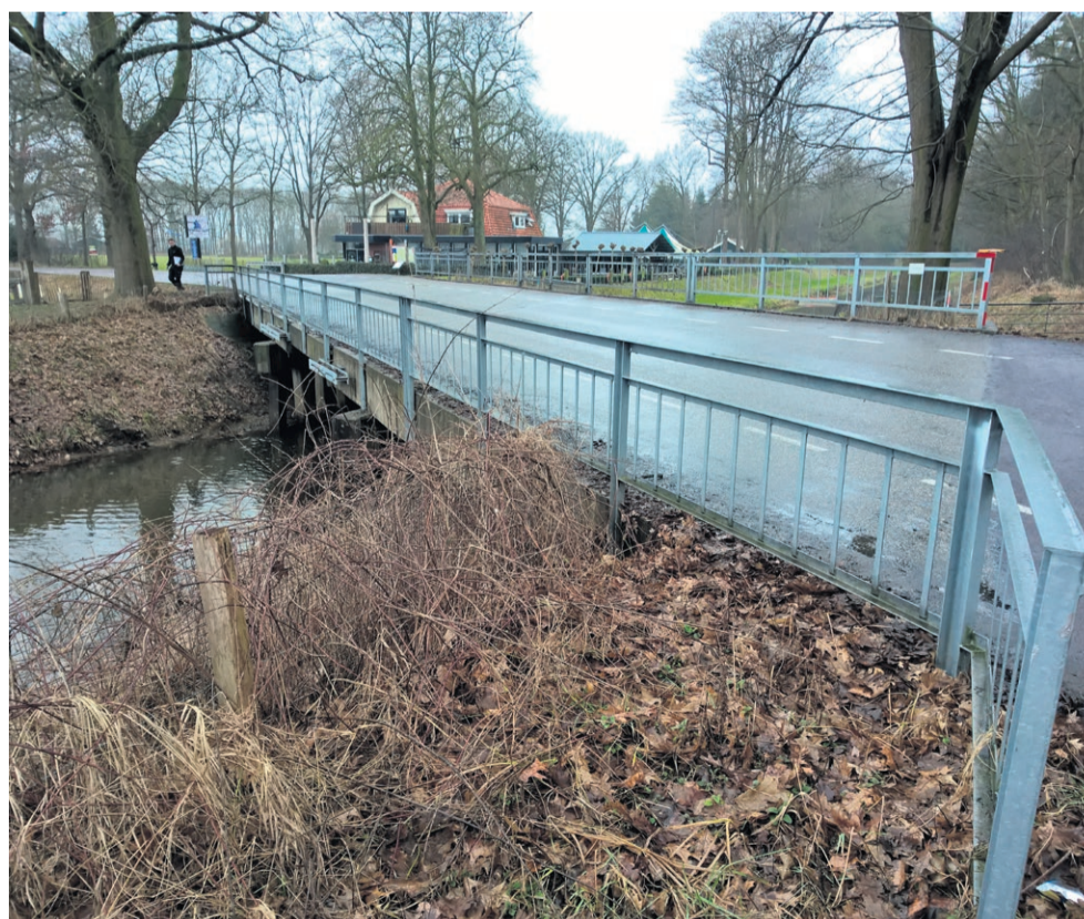
De constructie van de Oortjesbrug is niet berekend op het vele zware verkeer dat er tegenwoordig overheen rijdt. Bovendien is beginnende betonrot geconstateerd.

Het college van B&W heeft besloten een gewichtsbepaling in te stellen voor negen bruggen. De Oortjesbrug aan de Broekheurneweg mag nog maar belast worden met voertuigen tot 25 ton en wordt daarmee het meest ontzien. De constructie van deze brug is niet berekend op het vele zware verkeer dat er tegenwoordig overheen rijdt. Bovendien is beginnende betonrot geconstateerd. Voor de overige acht bruggen geldt een grens van maximaal 35 ton. Ook deze bruggen zijn destijds niet gebouwd voor zwaar verkeer. De gewichtsbepalingen worden ingevoerd om (verdere)